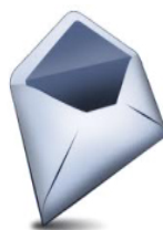
BUSTA PICCOLA DI COLORE BIANCO