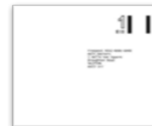
BUSTA PREAFFRANCATA per la restituzione al Consolato